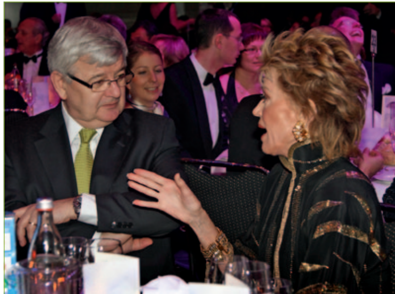
► Prominente Gäste beim Deutschen Nachhaltigkeitstag: Jane Fonda und Joschka Fischer

Im Rahmen der Veranstaltung, die unter der Schirmherrschaft von Bundeskanzlerin Angela Merkel hochkarätige Teilnehmer aus Politik, Wirtschaft und Forschung zusammenführte, wurden auch prominente Gäste für ihr Eintreten für mehr Nachhaltigkeit in Umwelt und Gesellschaft geehrt. Sonder- und Ehrenpreise gingen u. a. an